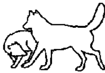
Underkastad / Dominant