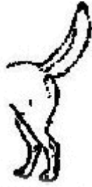
Hög - Dominant, Självsäker eller hotande