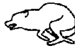
Springer av rädsla